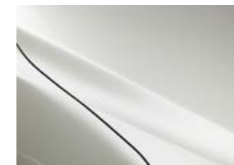
P Бела бисерна металик (25D)