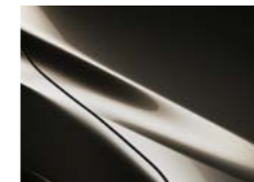
M Титаниум-кафена металик (42S)