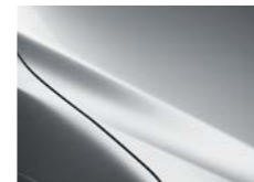
P Сребрена бисерна металик (45P)