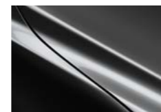
3P Liquid Metal Течен метал бисерна металик (46G)