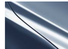
P Polymetal перлен металик

Доплата за металик MP - 500 ЕУР со ДДВ 3P - 900ЕУР со ДДВ