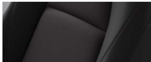
3D штоф со перфорација COMFORT + STYLE + SOUND + SAFETY