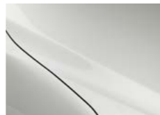
Артички бела (A4D)

Ниту еден дел од оваа публикација не смее да се репродуцира без претходна писмена согласност од Стар Моторс ДООЕЛ.