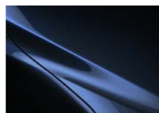
M Кралско син перлен металик (42M)

Доплата за металик MP - 500 ЕУР со ДДВ 3P - 900ЕУР со ДДВ