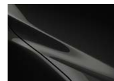
P Црна бисерна металик (41W)