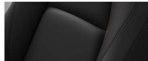
Кожен ентериер со перфорација во средината - LUXURY